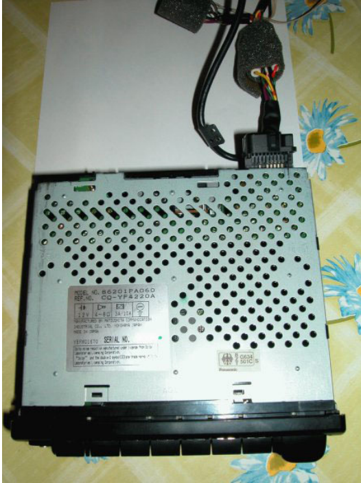
Radio von unten gesehen mit teilw. eingesteckten Stecker 1. (bei Blick in den montierten Quick-Out-Schacht ist es der linke Stecker!)